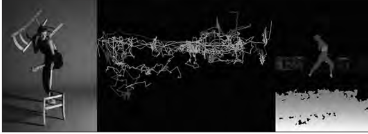
זרימת עבודה בזמנית, רקדנית: רנטה סקובו, ניו יורק 2017 Simultaneous workflow , dancer: Renata Skobo, NY 2017

ההגעה הקבועה והרציפה לסטודיו למחול, העבודה האינטנסיבית עם הרקדנים והעובדה הפשוטה, שבתוכי כפסל, מתקיים מאבק תמידי ביני לבין הפסלים על המרחב והרקדן, היוצר כל היום ולמחרת את המרחב היצירתי שלו פנוי כדף חלק, לא רק גרמו לי לקנאה אין סופית, אלא גם לחשש שהחלל רק נדמה ריק ושוב איני רואה ומולך שולל. בשיתוף פעולה עם תמר רגב, פיתחתי יחד אפליקציה המאפשרת לשרבט את תנועת הרקדן ללא אביזרים נלווים, כאשר הקו שנוצר הוא ביטוי להימצאות הרקדן בחלל בנקודות שונות לפי הריקוד.