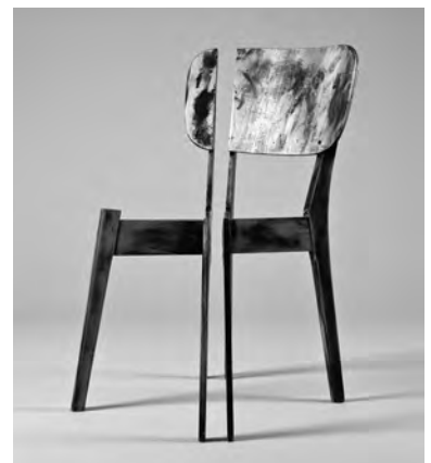
מידות משתנות, ישראל 2012 Dynamic Measurements , Israel 2012

כאומן, אחת האיכויות המובהקות של הפסל הוא גודלו. העובדה, שלפסלים אלו אין גודל קבוע אלא משתנה ודינמי לפי ההצבה, הובילה אותנו לבחון את המרווח בין שני חלקי הכיסא – איזה סוגי כוחות משיכה מתקיימים שם, שאולי איכות זו יכולה להתקיים באמצעותם. בחרנו לעשות זאת על ידי שיתוף פעולה עם להקות מחול ורקדנים, כדי לבחון את המרחב התנועתי עם הכיסא ולבדוק מה הקשר בין מחול עם כיסא (שכבר נעשה רבות בעבר) לתנועה עם כיסא, שהוא פסל.