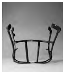
Simultaneously , Israel 2010

עם התפתחות הסדרה, נוצרו פסלי כיסאות כאלה, שנחצו לשניים, כך שכל מחצית הכיסא עמדה בפני עצמה.