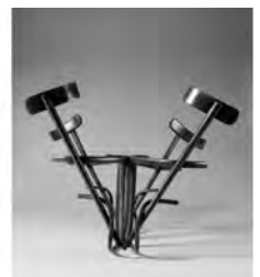
בוזמנית , ישראל 2010

כאומן, אחת האיכויות המובהקות של הפסל הוא גודלו. העובדה, שלפסלים אלו אין גודל קבוע אלא משתנה ודינמי לפי ההצבה, הובילה אותנו לבחון את המרווח בין שני חלקי הכיסא – איזה סוגי כוחות משיכה מתקיימים שם, שאולי איכות זו יכולה להתקיים באמצעותם. בחרנו לעשות זאת על ידי שיתוף פעולה עם להקות מחול ורקדנים, כדי לבחון את המרחב התנועתי עם הכיסא ולבדוק מה הקשר בין מחול עם כיסא (שכבר נעשה רבות בעבר) לתנועה עם כיסא, שהוא פסל.