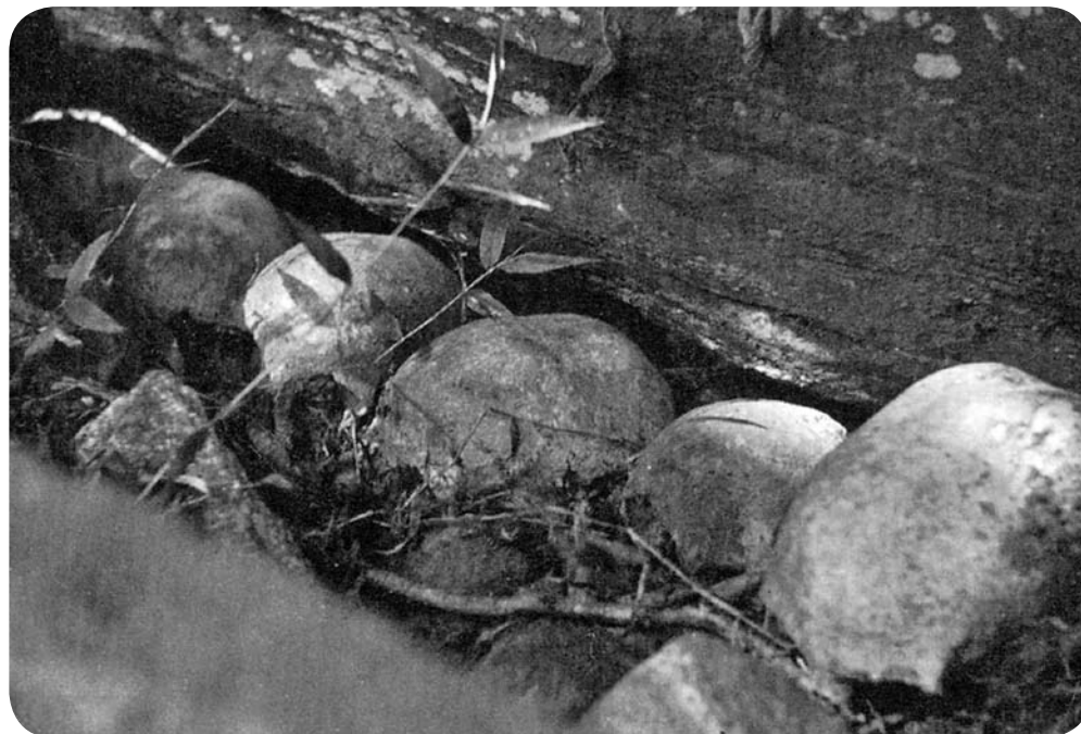
The skulls in the sacred cave

בשלושת המקרים, כמו בתאיתיה, התהלוכות היו אירוע חברתי. לתהלוכות התאיתיה נוסף אלמנט דתי מקודש, שלא היה בתהלוכות האחרות. לכן להגדרה של תהלוכת התאיתיה יש להוסיף: "אירוע חברתי-דתי". על תהלוכות בקונטקסט דתי חשוב לשמוע מה יש לאפריקנים להגיד.