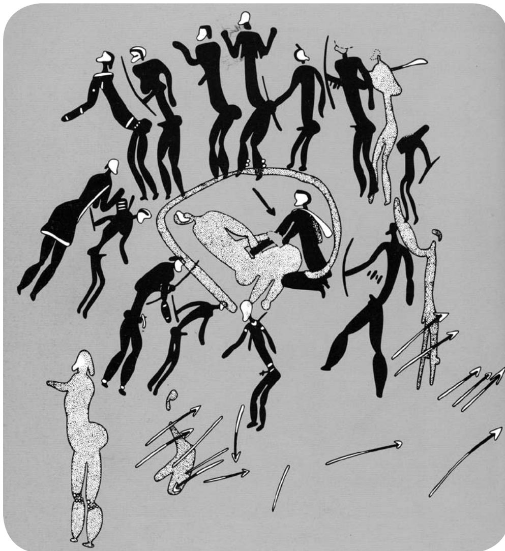
Rock painting in Natal Drakensberg of a circular curing dance. In the center, a kneeling shaman lays hands on patient

נשאלת השאלה מדוע בני הגיריאמה והתאיתה נעדרים מהמפה המצורפת, ואילו המסאי כן נכללים בה (ראו עמוד 52). התשובה טמונה בגיאוגרפיה. בעוד התאיתה והגיריאמה התגוררו במרחק רב מניירובי, בני המסאי חיו לא הרחק מניירובי ויישוביהם היו פזורים מדרומה. למרות