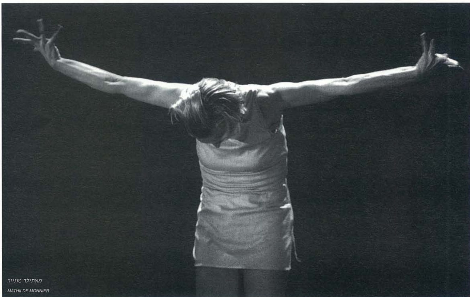
מאתילד מונייר MATHILDE MONNIER

מרכז כוריאוגרפי זה מצטרף ל-14 אחרים הפועלים בצרפת. חצי מתקציבו מגיע מהממשלה והשאר מהעירייה ומהמועצה המקומית. השם "מרכז כוריאוגרפי", בניגוד ל"מרכז למחול", מצביע על ייעודו - כמעבדה ניסיונית לכוריאוגרפיה מודרנית. בכל מרכז פועל כוריאוגרף עם להקה (למשל מאגי מארן, קארין סאפורטה) שמתחייבים להעלות מופע בשנה או שני מופעים בשלוש שנים. הם גם