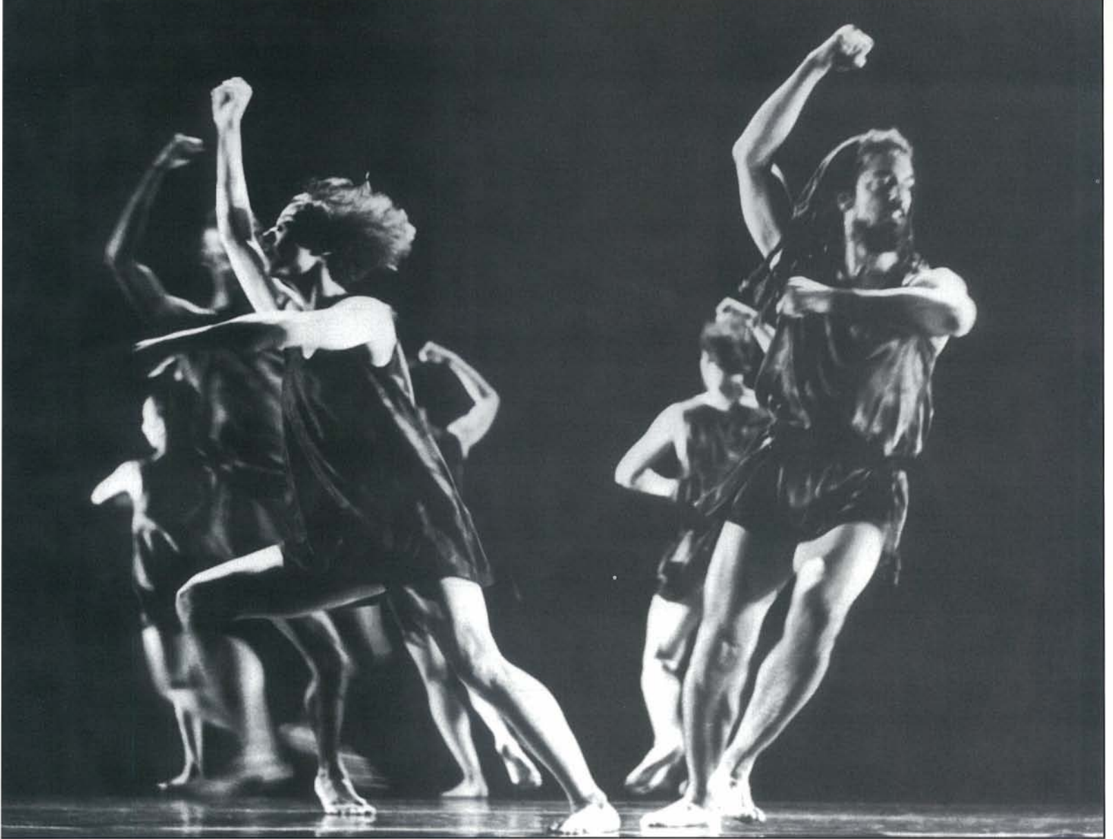
להקת מרק מוריס: "דואו גדול"