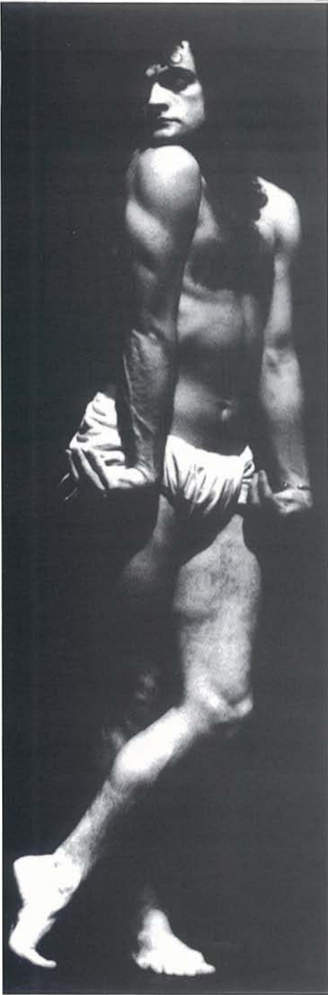
מרק מוריס MARK MORRIS