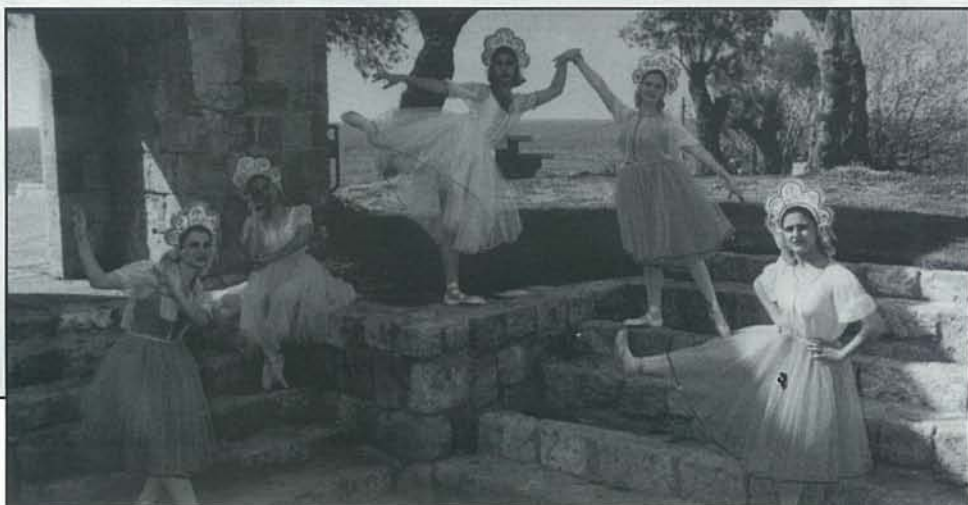
"שחרזאד", כפר יאסיף

היום, עם השינוי בסגנון הריקודים, מספר ההופעות של הלהקה גדל, והקבוצה מפורסמת במגזר הערבי ואף ייצגה את מדינת ישראל בפסטיבלים באוקראינה, בפולין והשנה בהונגריה. השנה קיבלה "שחרזאד" תקציב מהמחלקה הערבית במשרד החינוך אך גם עליה מעיקים חוסר הכרה מצד המוסדות ומחסור במשאבים, ודוחים את מימוש שאיפתה לפתוח בית ספר ראשון לריקוד במגזר הערבי ולהוסיף מורים וסטודיות. הצצה לכפר יאסיף ולבשמת טבעון מראה שיחד עם הרצון לשמר מסורת יש פתיחות לקלוט דברים חדשים ורצון לעשייה מקורית. חוסר הכרה מצד המוסדות והעדר תמיכה כספית מעכבים התפתחויות מעניינות בתחום המחול במגזר הערבי בישראל.