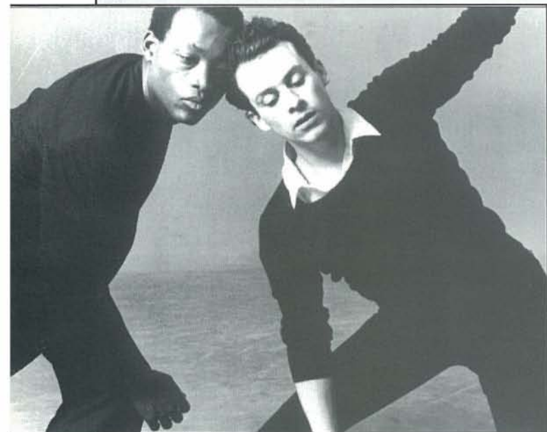
ביל טי ג'ונס וארני ז'ין BILL T. JONES AND ARNIE ZANE

חוששני, שהחלטתה של ארלין קרוציה, שאת דעתה אני מעריך בדרך כלל מאוד, שלא לראות את המופע של ביל טי ג'ונס על אודות