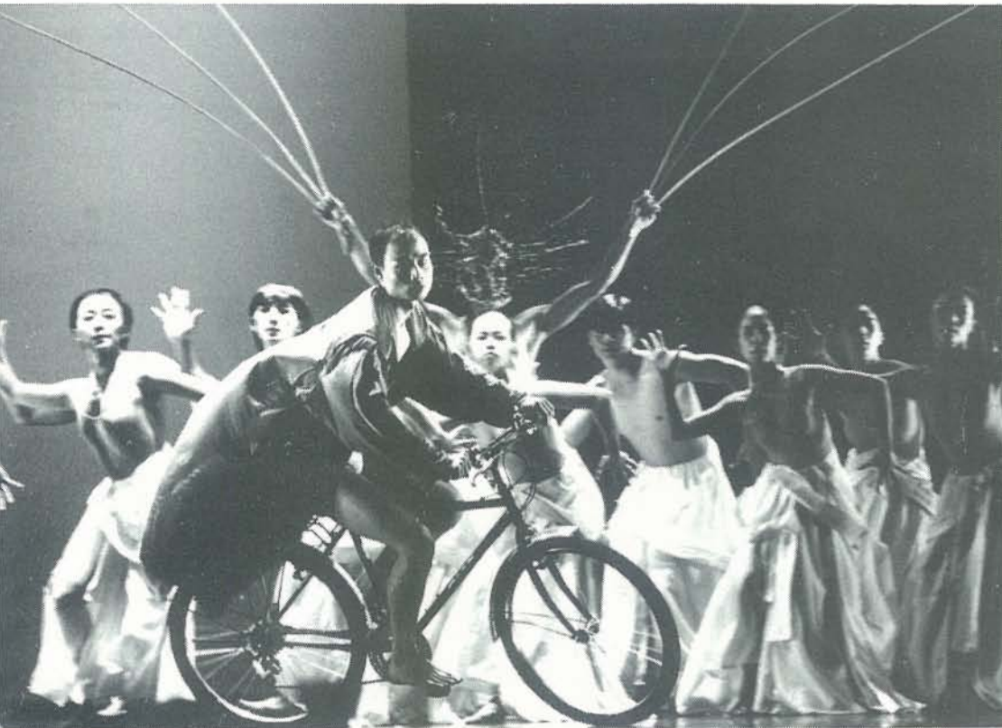
"תשעה שירים" תיאטרון מחול שער העננים