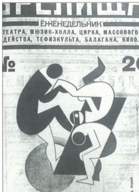
"מחול חשמלי" מאת ניקולאי פורגר ולהקתו "רקדני המכוונות" - 1923, ציור: בוריס ארדמן "ELECTRIC DANCE" FROM NIKOLAI FOREGGER'S MACHINE DANCERS, 1923.

לכל אחד מיוצרי המחול, כגון באלאנצ'יבדזה (לימים באלאנשין), קאסיאן גולייזובסקי, ליאוניד ז'וקוב, ניקולאי פורגר, היו רעיונות אסתטיים משלו, אותם ניסה ליישם במסגרת