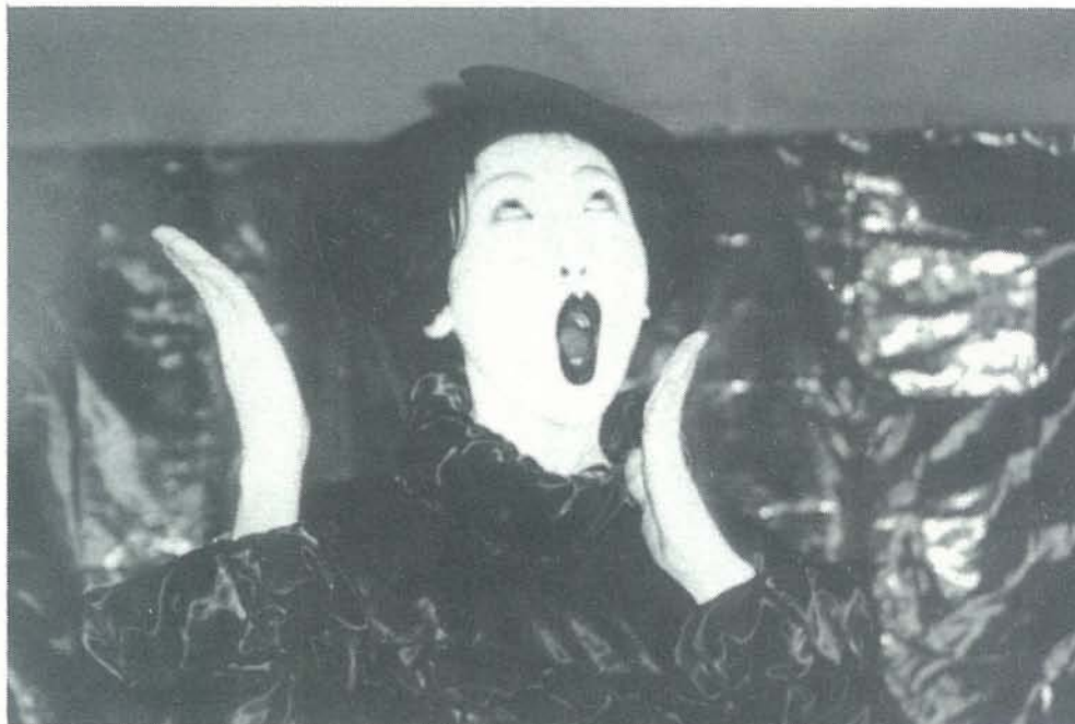
"OP EKLEKT", JAPAN, יפן, אקלקטי"

It came as no surprise - and one may assume the members of the jury were unanimous in their