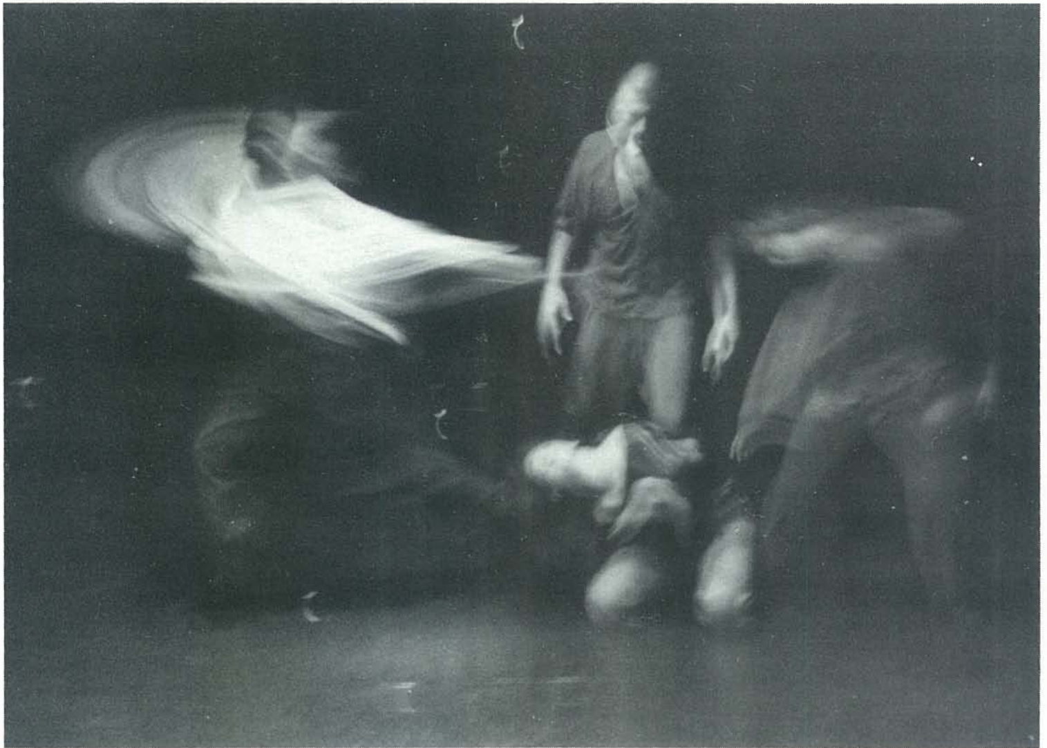
▲ להקת "לאנונימה אימפריאל", ספרד, צילום: יורם רובין "ECO DE SILENCI", CHOR.: JUAN CARLOS GARCIA LANONIMA, IMPERIAL, SPAIN