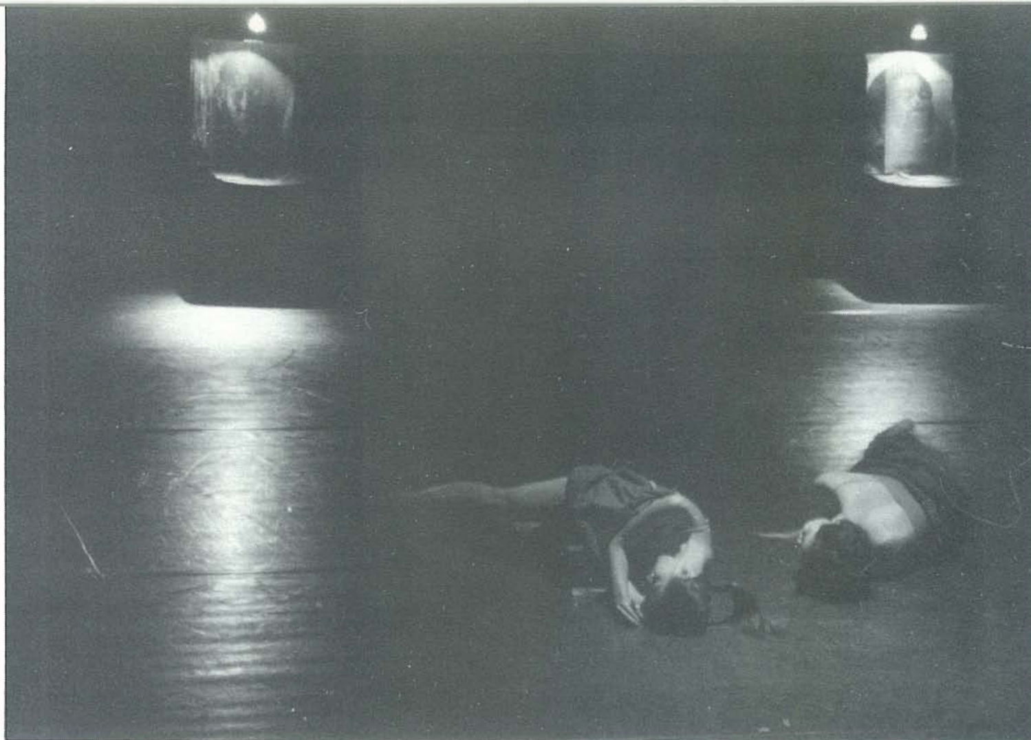
להקת המחול המודרני - סיאול, קוריאה SEOUL CONTEMPORARY DANCE COMPANY, KOREA