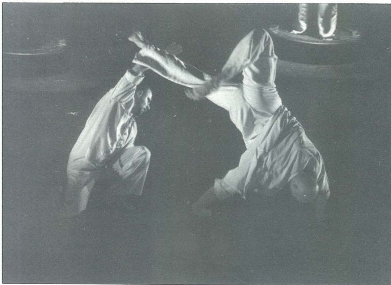
הבאלט המודרני מסאגאד, טרנס דאנס, הונגריה, צילום: יורם רובין SZEGED CONTEMPORARY BALLET, TRANZ DANZ COMPANY, HUNGARY

תחרות המחול הבינלאומית • מרכז סוזן דלל • 1994