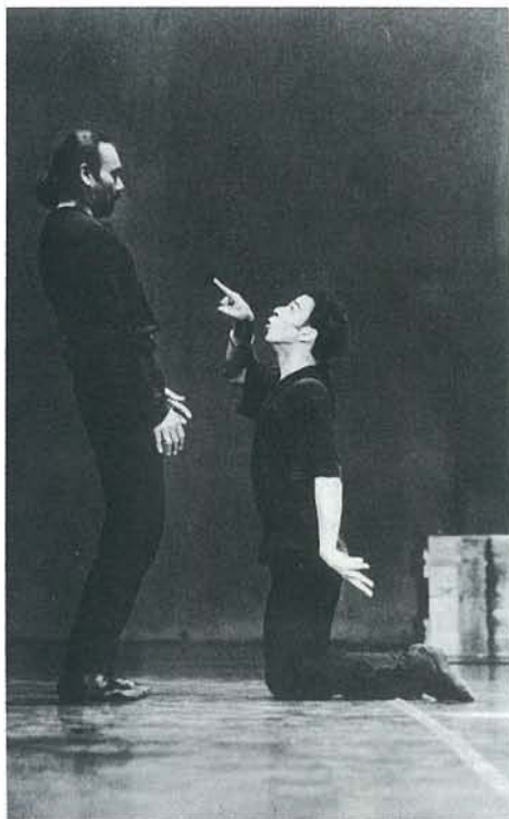
באלט לוזאן של מוריס בז'אר "המלך ליר - הקוסם פרוספרו" BEJART BALLET LOUSANNE "KING LEAR - PROSPERO"

הניצים. לבסוף תלויים-יושבים שני האוהבים על גבי קולבים הקבועים בקיר התפאורה של בתי העיר. למה? אין לי מושג.