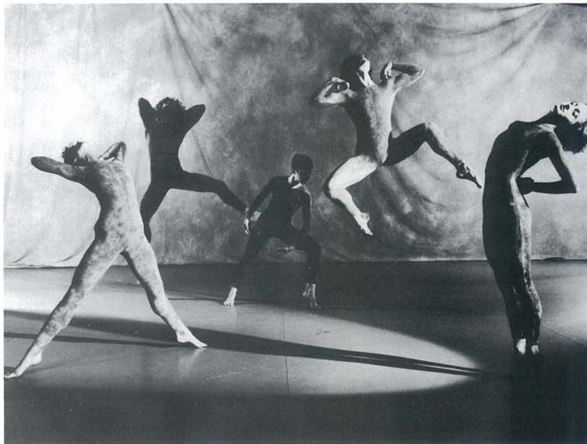
להקתו של מרס קאנינגהם - "שינויי כתובת" MERCY CUNNINGHAM COMPANY - "CHANGE OF ADDRESS"

את המחול המודרני בחיתוליו, משחזרות לאחרונה מספר להקות, ושמות כטד שון ורות סנט-דני, איזדורה דנקו, דוריס האמפרי וצ'ארלס ויידמן, כבר פחות זרים לאוזן. החיאת היצירות שלהם, החושפת אוצרות עלומים, מסייעת גם לשימור חומר המתועד