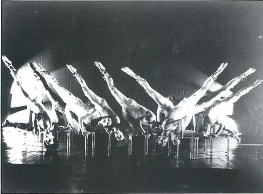
"Aviary" Nikolais Dance Theatre ; להקת אלון ניקולאיס