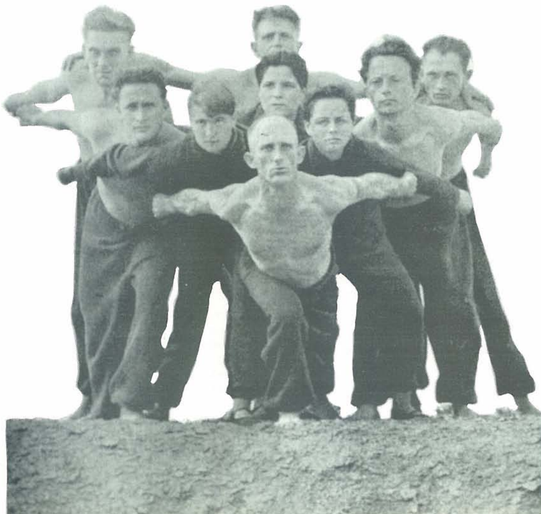
תמונת הסיום מ"מקהלת העמלי" - להקת איגוד הפועלים מהעיר האנובר Final scene of "Work Choir" performed by the Movement Group of the Workers of Hannover