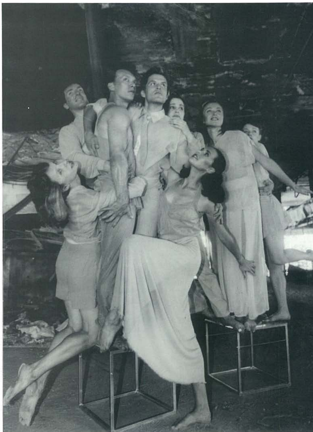
רקדניות "בת דור" באחת הסטודיות שעלו באש "Bat-Dor" dancers in one of their studios after fire damaged the building

שעה שמאץ אק הודיע לפני מספר חודשים, שהוא מתכנן לקחת "פסק-זמן", וגמור עימו שלא להמשיך למלא את תפקיד המנהל האמנותי של להקתו, "באלט קולברג" השוודי, שהופיע לא מכבר בארץ במסגרת פסטיבל ישראל, החל חיפוש נמרץ אחרי מי שאמור