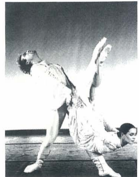
מתוך "שלוש אחיות"; כוריאוגרפיה: ואלרי פאנוב, "באלט האופרה של העיר בון" From Valery Panov's "Three Sisters"; "Bonn Municipal Opera Ballet"

ואלרי פאנוב, המנהל האמנותי של באלט האופרה של בון, גרמניה, מעלה שוב את יצירתו, אותה הוא מגדיר כ"פאנטזיה על נושא מאת צ'כוב", שיצר לפני שנים אחדות עבור באלט האופרה של ברלין. הבכורה התקיימה