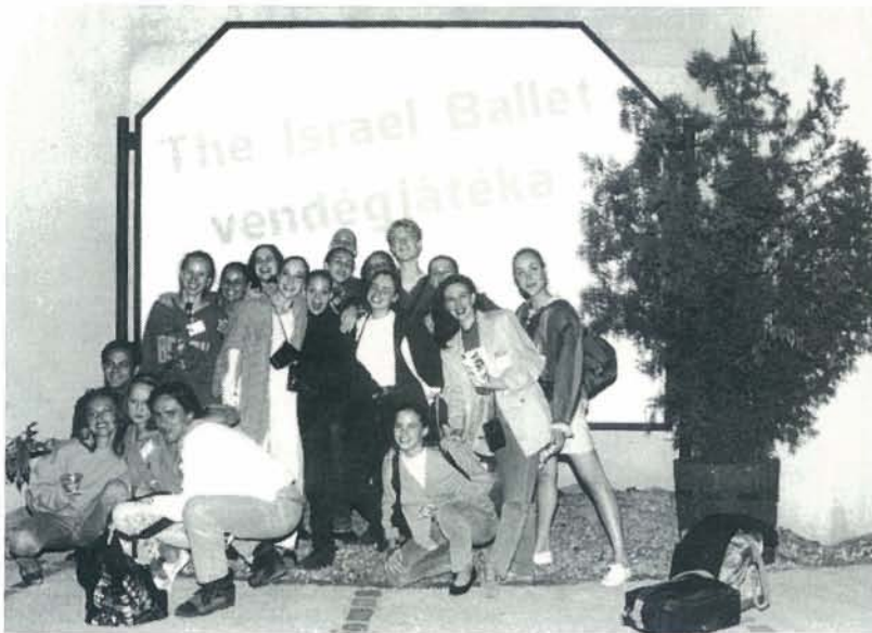
רקדני "הבאלט הישראלי" בעת סיורם בבודפשט Dancers of the "Israel Ballet" during their recent tour in Budapest

המתכת, מגרה, אבל בלתי ניתנת להשגה, מעבר למגע ידם של הגברים שסביבה. שלא כמו ב"בולרו" של מוריס בז'אר, היא לא ניצבת על גבי שולחן אלא מתגרה בבחורים, עד שגיוסף ציפולה מצליח להשיג אותה. הדואט של שניהם מלא רקיעות של פלאמנקו וכפיפות לוחטות - קלישאות משומשות, שהשניים מצליחים בכל זאת לבצע במיומנות. "הארט כבר סומן ככוריאוגרף עולה - ציפיה שתמיד צופנת סכנות ליוצר צעיר. ירחובי היא עבודה מוקדמת, מוקדמת מכדי לאשר סופית את התקוות שתולים בו, אבל זו התחלה טובה. מה שנחוץ לו הם הדרכה וטיפוח, ולא עודף שיפה".