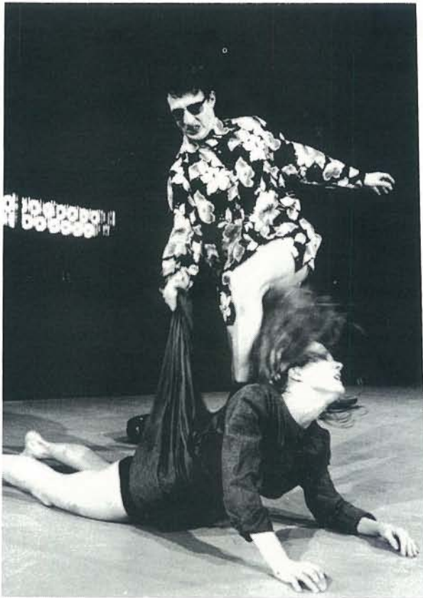
מתוך "אולריקה מיינהוף" בתיאטרון העיר ברמן "Ulrike Meinhof", the Bremen Municipal Theatre

שהיה ראש המשטר הקומוניסטי, אריך הונקר (שהורשה לאחרונה להגר לדרום-אמריקה, משהופסק משפטו מסיבות גיל ובריאות לקויה). מולו ניצב קצין-S.S. במדים שחורים, קורע מגופו של המנהיג את בגדיו, דוחף לו בלי רחמים ביצים אמיתיות, בלתי מבושלות, לתחתוניו ומועד אותן.