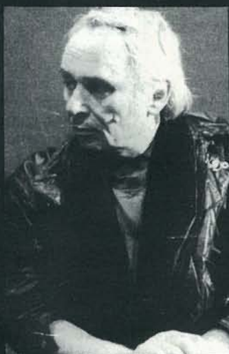
יוהאן קרסניק Johann Kresnik

התיאטרון הכוריאוגרפי של הנס קרסניק הוא תיאטרון חזותי אמיתי. יצירותיו הן מהסוג שאי אפשר להשאר אדיש כלפיהן. גם שונאיו - הרבים למדי - וגם תומכיו הנלהבים מאוחדים בדעה, שהוא יוצר רגיש, שאינו מרחם על הצופים, או על הרקדנים שלו. ואולי יש גם בנחרצות וקיצוניות זאת משהו מאותו "אופי גרמני", שגרם בעבר סבל כה רב לאנושות.