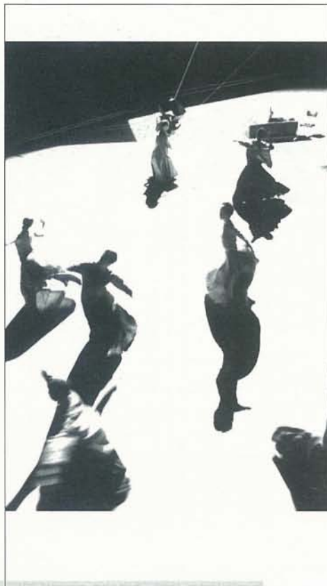
"אדוס: טלוס", באלט פרנקפורט כור: וויליאם פורסיית, BALLET FRANKFURT "EIDOS: TELOS" CHOR: WILLIAM FORSYTHE

תזמורת גדולה. שיטתו הרחיבה בצורה ניכרת את מגוון הצלילים. שנברג שאף גם לשינויים מהותיים באסתטיקה המוזיקלית. שנברג דגל בשוויון בערכם של כל הצלילים, ופורסיית מגשים גישה זו על ידי יחס שווה לחלוטין לכל רקדן ורקדן. המבצעים "מתנפלים" בלהיטות על התנועות ומטביעים את הצופה בזרם אדיר של רגשות מתחלפים. מנעד הרשמים נע מעצבנות מרגיזה ועד להדגשות זוהרות ממש.