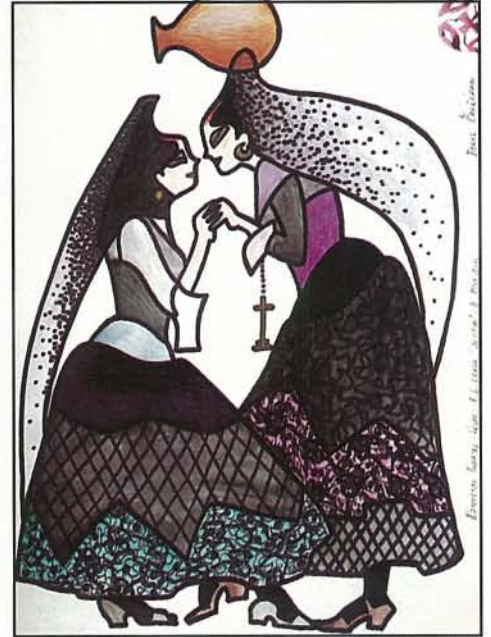
"ירמה", התיאטרון הלאומי, יוגוסלביה "YERMA", NATIONAL THEATRE, VRŠAC, YUGOSLAVIA

האם אתה מרבה לשוחח ארוכות עם הכוריאוגרף שלמענו אתה מעצב לפני תחילת העבודה?