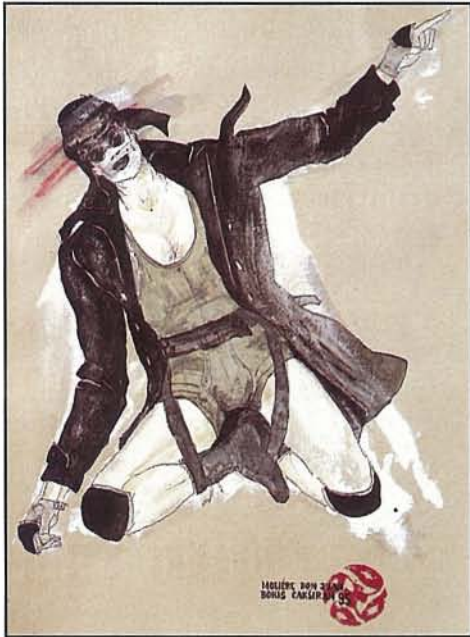
"דון חואן", התיאטרון הלאומי, בלגרד, יוגוסלביה "DON JUAN", NATIONAL THEATRE, BELGRADE, YUGOSLAVIA

איזה נס קטן, שיקרה משהו מדהים ובלתי צפוי או מפתיע. השינוי יכול להיות הדרגתי. למשל, תלבושת ארוכה מתקצרת, ורק לאט לאט חש הצופה בשינוי. או שהתלבושת הופכת מכהה לבהירה או להפך. וסמליות יכולה גם היא להתבטא בצבע. נאמר הרקדנית באדום פוגשת דמויות בלבן. או שהאישה הרוקדת בשימלה צבעונית מרימה אותה והופכת אותה ללבנה.