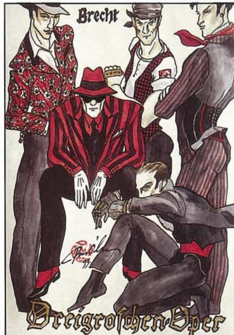
"אופרה בגרוש", תיאטרון ביטף, בלגרד, יוגוסלביה "THREE-PENNY OPERA", BITEF THEATRE, BELGRADE, YUGOSLAVIA

אני נותן לרקדנים המשתתפים בסדנה לעצב את התנועה שלהם ואת תלבושתיהם. זהו תהליך משולב. וכך לומדים הרקדנים לחשוב לא רק על התנועה אלא על התלבושות שלהם. אחרי שהם יוצרים את התנועה ואת הלבוש, אני לוקח להם את הלבוש שעיצבו, ונותן אותו למישהו אחר בקבוצה, כדי שיחוש בהבדלים