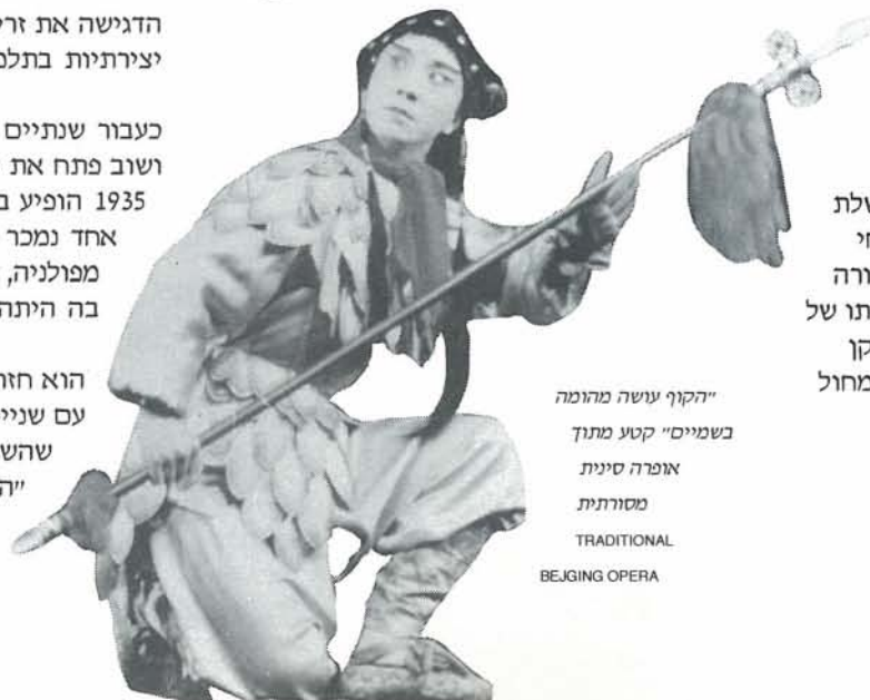
"הקוף עושה מהומה בשמיים" קטע מתוך אופרה סינית מסורתית TRADITIONAL BEIJING OPERA