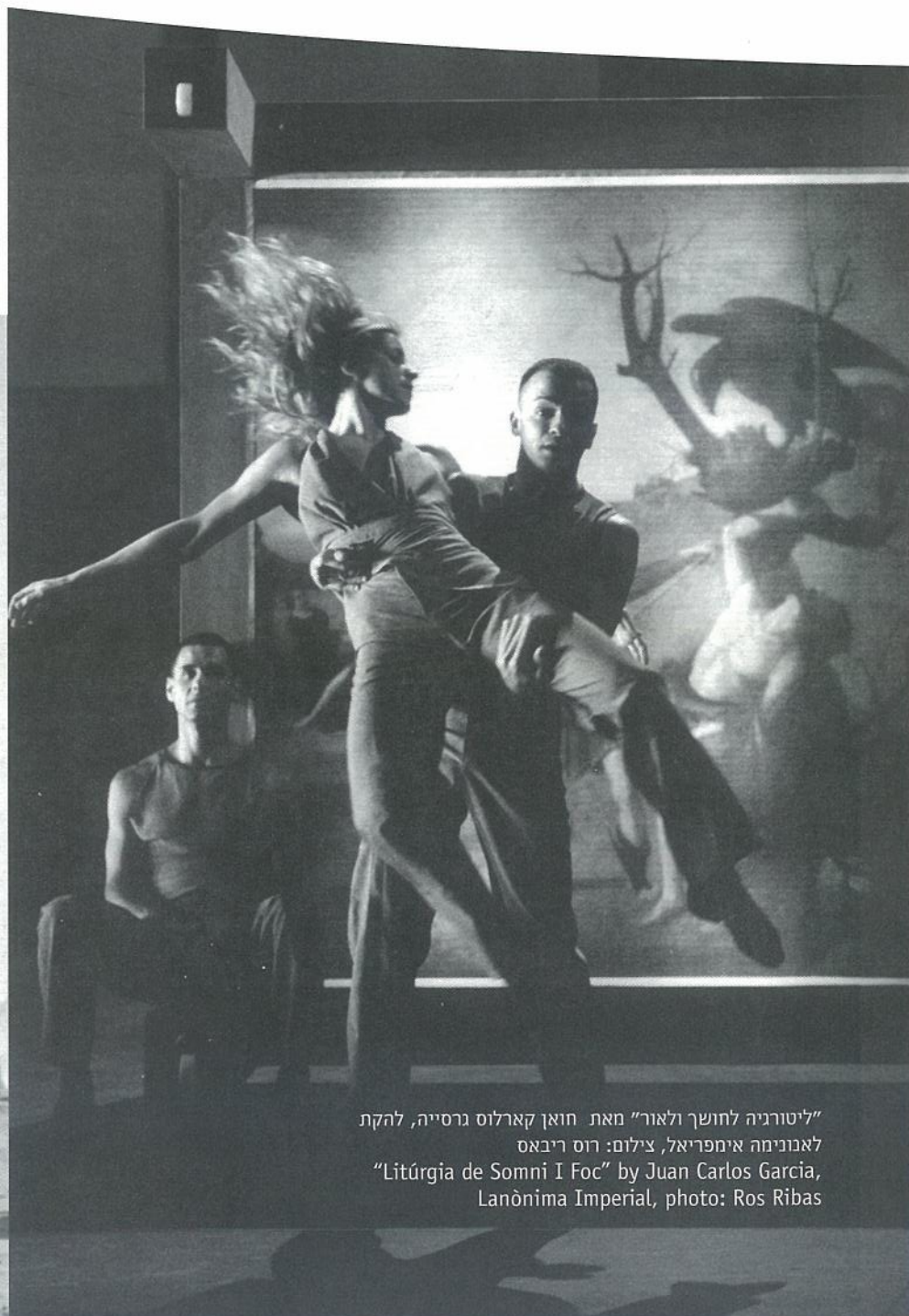
"ליטורגיה לחושך ולאור" מאת חואן קארלוס גרסייה, להקת לאנונימה אימפריאל, צילום: רוס ריבאס "Liturgia de Somni I Foc" by Juan Carlos Garcia, Lanonima Imperial, photo: Ros Ribas

גם התפקיד הנשי המרכזי, שבוצע על ידי מי שהיא גם מנהלת התיאטרון, היה נועז ומתגרה. משהו שם הזכיר את תיאטרון האבסורד; יש בשעשועים המקבריים הללו - במסווה ההגזמה והבוטות - מחשבה