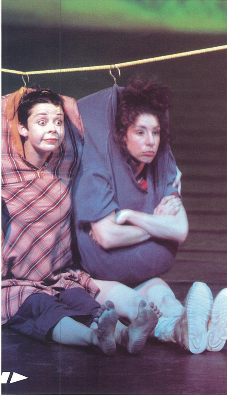
"לורלור", מאת יסמין ורדימון, צילום: דארין זאמיט לופי "LureLureLure" by Jasmin Vardimon, photo: Darrin Zammit Lupi

"אני מאוד אשמח להופיע כאן", היא אומרת, "אבל זה צריך להיות בהתאם לדרישות שלנו. צריכים לשלם לנו עבור ההופעות בדיוק כמו שמשלמים לנו בכל העולם". ואכן, עד שלא נפנים שצריך לשלם כאן לאמנים, גם כאלה שהם "משלנו", לא נהיה ככל העמים, וחבל.