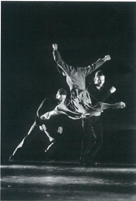
סדנת המחול מטה אשר, "למטה בצפון" מאת מאץ אק Match Asher Dance Workshop, "Down North" by Matz Ek

New York University www.nyu.edu/tisch/dance