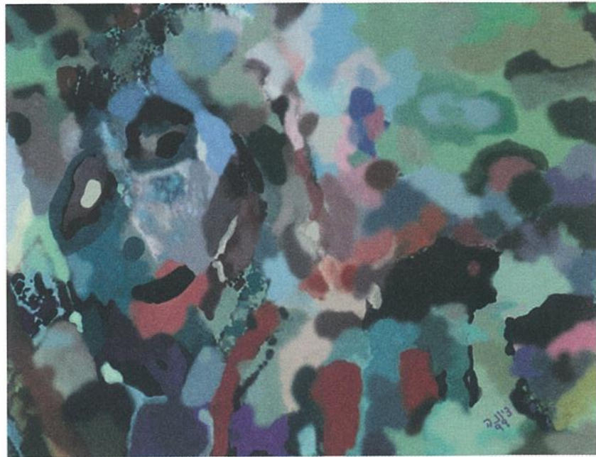
כל התמונות ברשימה מתוך "בקץ הדרכים" All photographs from "At the End of the Roads"

מבט אל תהליך העבודה של "בקץ הדרכים": מחול אורטורי ממוחשב