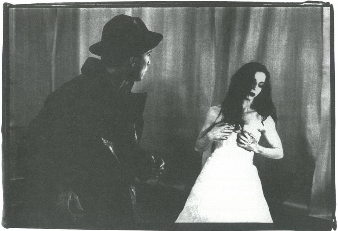
תיאטרון מחול אדפוס, "הצמא האנושי" מאת דימיטרי פאפיונו Edafos Dance Theater, "Human Thirst" by Dimitris Papaioannou