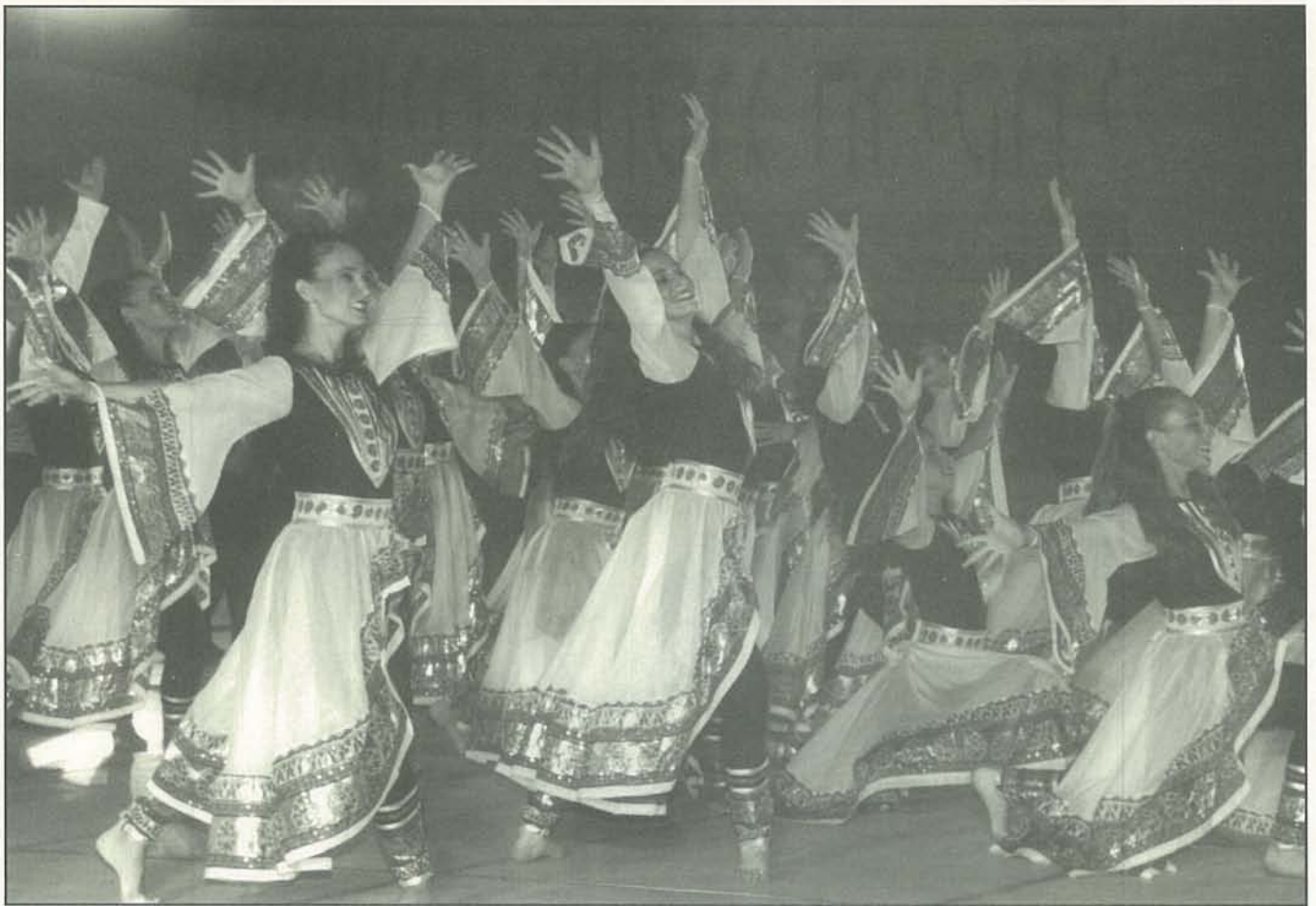
פסטיבל מחול כרמיאל 1996