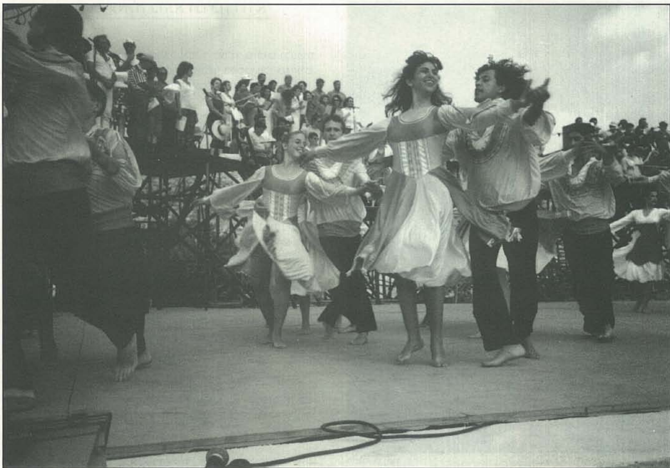
פסטיבל מחול כרמיאל

הניסיונות המעניינים שצמחו בעידוד יונתן כרמון. לדוגמה: 1. ימין ושמאל - מחרוזת לפי כרמון, ברי אבידן, 2. ריקודי שלום כרמון - ברי אבידן, 3. ריקודי יונתן גבאי, אורן הללי ו-3. ריקודי תמר אליגור, דדו. ניסיון זה משמר את רוח היצירה העממית וכידוע ריקודי עם רבים לא נוצרו כריקודי במה.