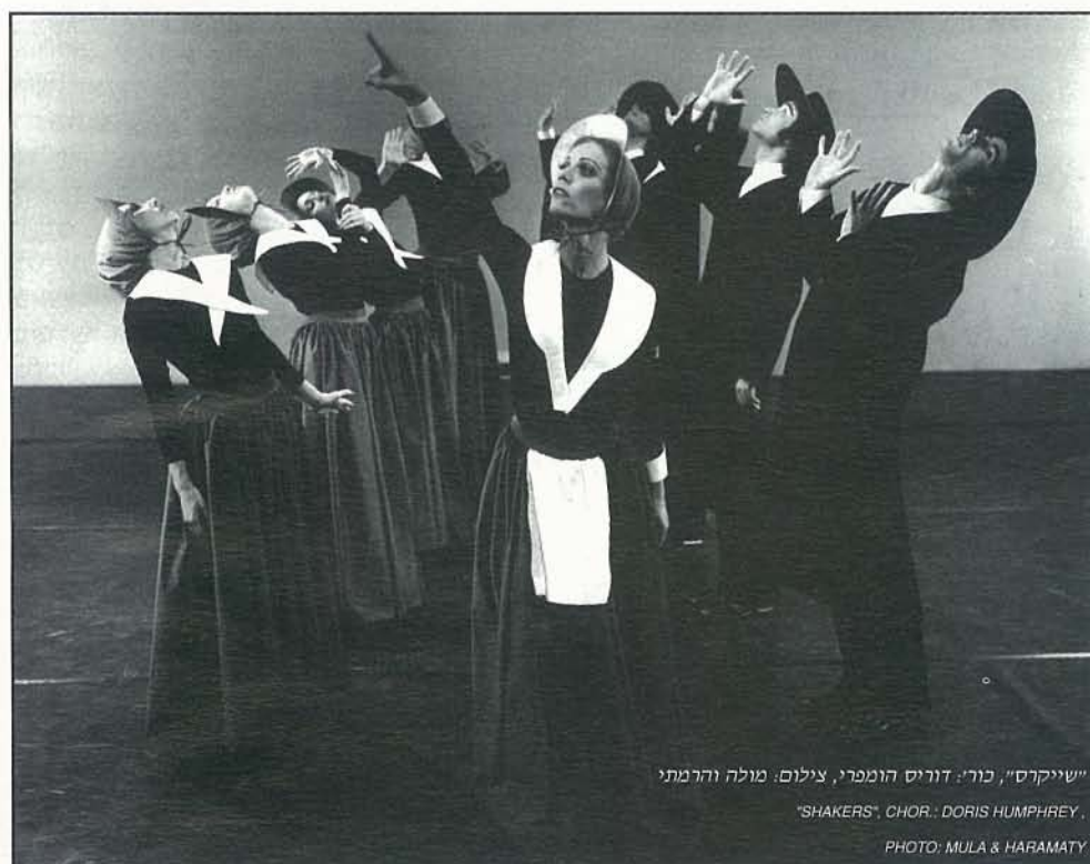
"שייקס", כור: דוריס הומפרי "SHAKERS", CHOR.: DORIS HUMPHREY